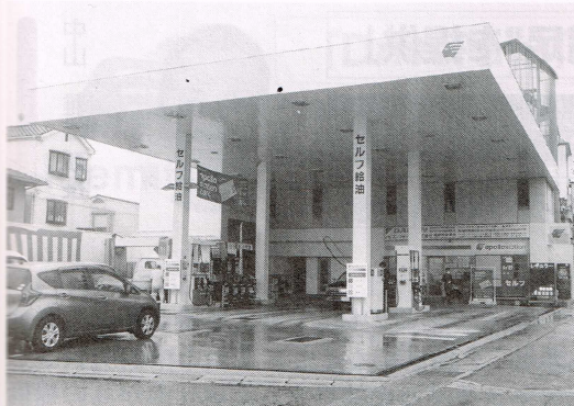
セブンフォーラム セルフ嵯峨野CS

ら「新たなCS作り」。CS…SDGsの構築（CSホームライフステーション）に向けて、CSを「エコ給湯専門の施工販売」と位置付け、ホームライ