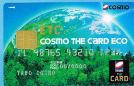
コスモ・ザ・カード・ハウス「エコ」