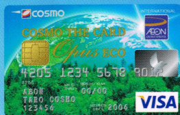
コスモ・ザ・カード・オーバス「エコ」